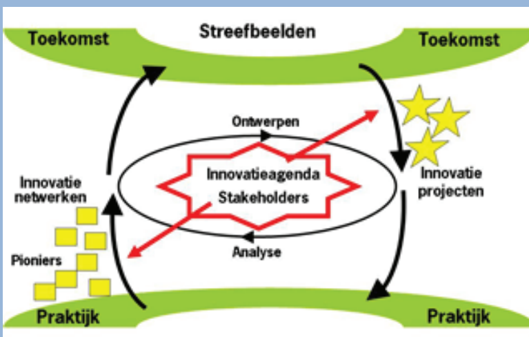
Figuur 1. Systeeminnovatieaanpak.

In elke sector ontwikkelen onderzoekers en bedrijfsleven teeltsystemen op hun eigen tempo. Kennis en ervaringen worden tussen sectoren en met de glastuinbouw uitgewisseld. Overkoepelend is er aandacht voor emissiereductie en waterbalansen, duurzaamheid en perspectieven van de teeltsystemen, burgerpercepties en communicatie naar alle stakeholders. De projecten worden gefinancierd door het ministerie van EL&I en het bedrijfsleven. Daarnaast vindt verdiepend onderzoek plaats in de kennisbasis en worden aanpalende projecten op diverse thema's uitgevoerd.