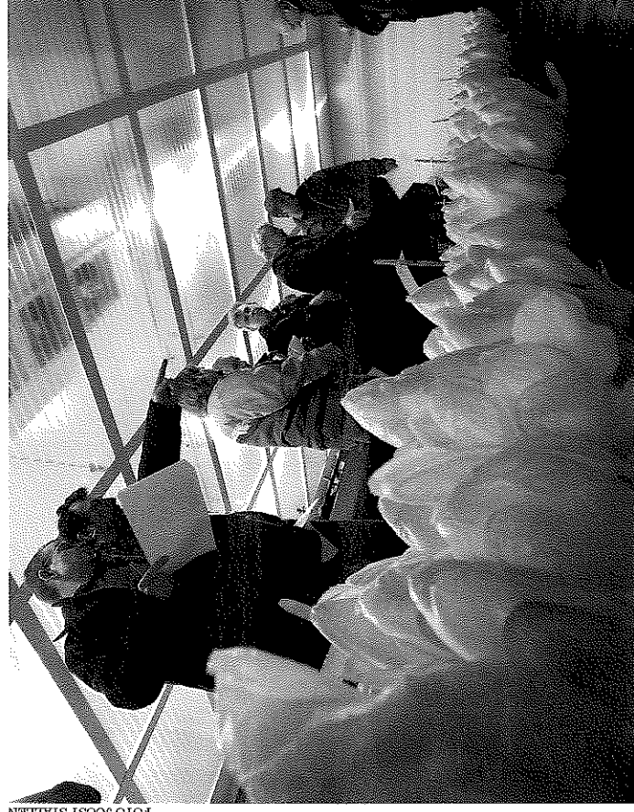
Tijdens de witlofbiënnale zijn ook rassenproeven te zien.

Opgave voor het symposium moet gebeuren voor 17 september bij de organisatie van de witlofbiënnale: LTO Vollegrondsgroente.net. Een inschrijfformulier is te downloaden op www.vollegroendsgroente.net . De eerste dag vindt plaats in Event Center 'Nieuwe Buitensociëteit Zwolle' op het Stationsplein 1 in Zwolle. De tweede dag is vrij toegankelijk en start om 10:30 uur bij Kees van Dun, Vaartweg 82 in Espel. ●●●