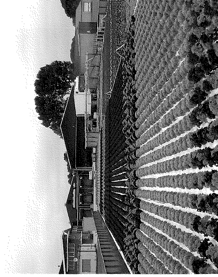
Firma Pater & Co teelt 700 vierkante meter op water.

Door Marga van der Meer freelance journalist