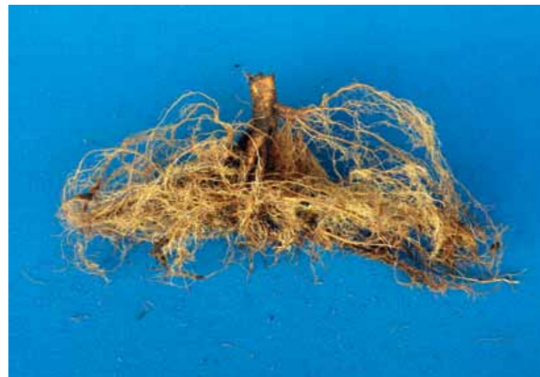
Gotenteelt van Pyrus calleryana 'Chanticleer' leverde veel en fijn vertakte wortels op (links), terwijl vollegrondsteelt tot een grover wortelgestel leidde (rechts).

koel voorjaar, een warme juli en een natte augustus. Het groeiseizoen in 2011 begon in de lente zacht en was koel en nat in de zomer.