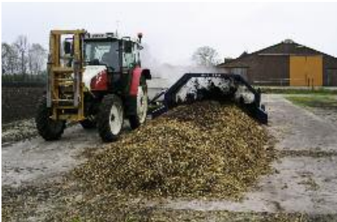
Composteren op de boerderij.

Omdat er meer regen valt dan er water verdampt, spoelen in water opgeloste voedingsstoffen uit naar grond- en/of oppervlaktewater. Bodems kunnen deze voedingsstoffen niet allemaal vasthouden. Dat geldt voor zandgronden meer dan voor kleigronden. Op klei leidt waterverzadiging tot stikstofverliezen naar de lucht via denitrificatie, een verschijnsel dat op zandgronden veel minder voorkomt.