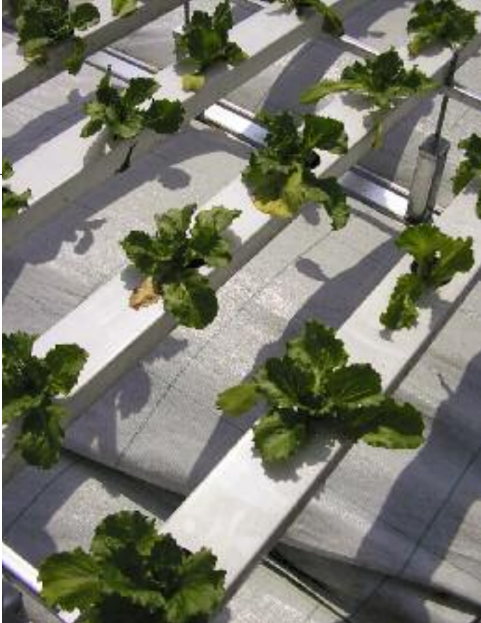
Teelt de grond uit: ijsbergsla in goten.

verplaatsen, veelal naar het buitenland. Daarmee wordt ook het probleem van nitraatuitspoeling geëxporteerd en wordt Nederland afhankelijker van andere landen voor de voedselproductie. Al met al biedt dit geen perspectief op een duurzame landbouw.