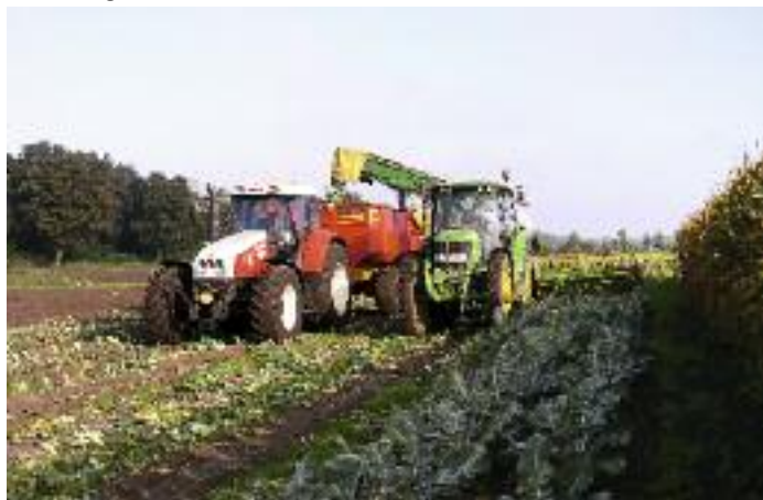
Afvoer van gewasresten.