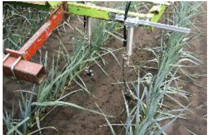
Toediening meststoffen met pulsortechniek.

De drie zoekrichtingen zijn vanaf 2005 tot en met 2008 beproefd op proefbedrijf Vredepeel van Wageningen UR in het zuidoostelijk zandgebied. De onderzoeksopzet voorziet in twee bedrijfssystemen: een geïntegreerd systeem en een biologisch (zie voor meer details Haan, 2006). Onderzoek, met name voor de derde zoekrichting,