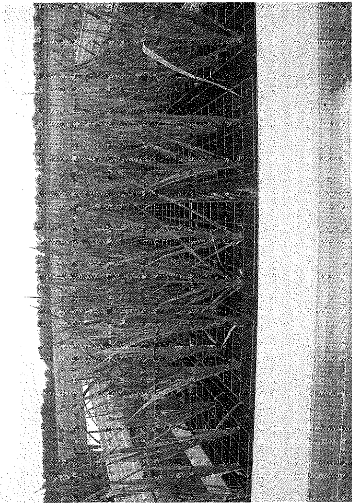
Vredepeel onderzoekt de teelt van prei op water. Zwaagdijk onderzoekt bladgewassen in teelt uit de grond.